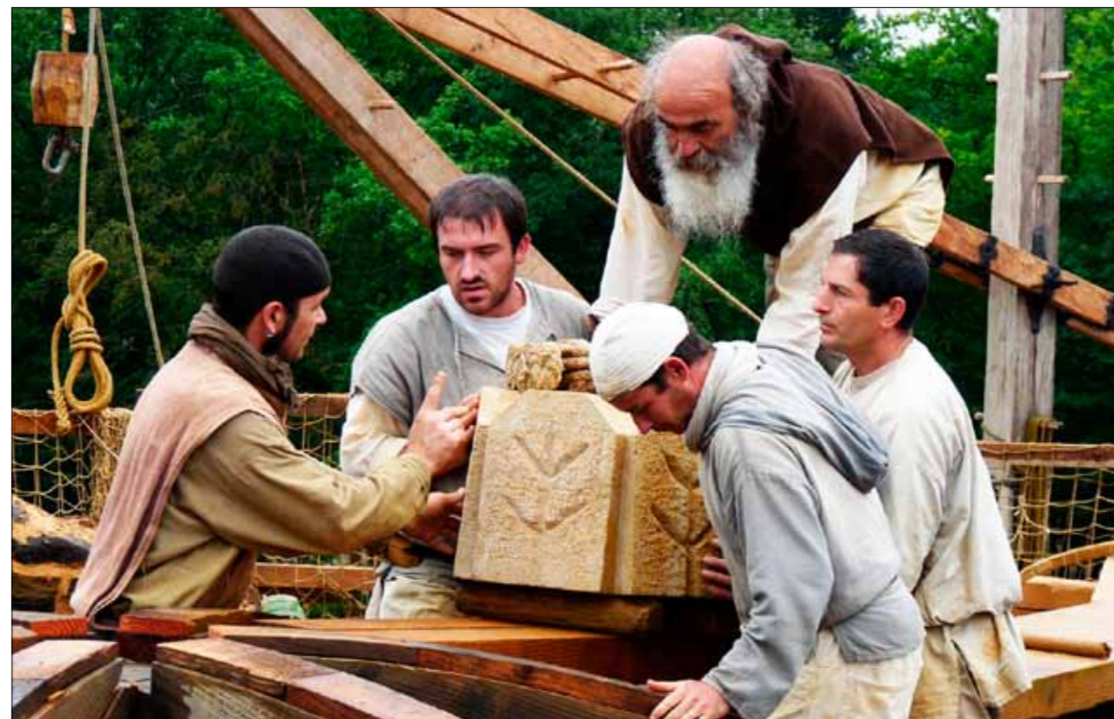
Comme une clé de voûte (ici à Guédelon en France), mettre l'homme au centre, est une nécessité urgente pour les observateurs actuels du monde du travail. Un précepte déjà édicté par saint Benoît au VI e siècle...

En revanche, ces deux univers se rencontrent sur un autre point: le droit à l'erreur. Considérons la communauté monastique: elle fonctionne selon une dynamique du don, depuis sa réception (temps de la "dé-