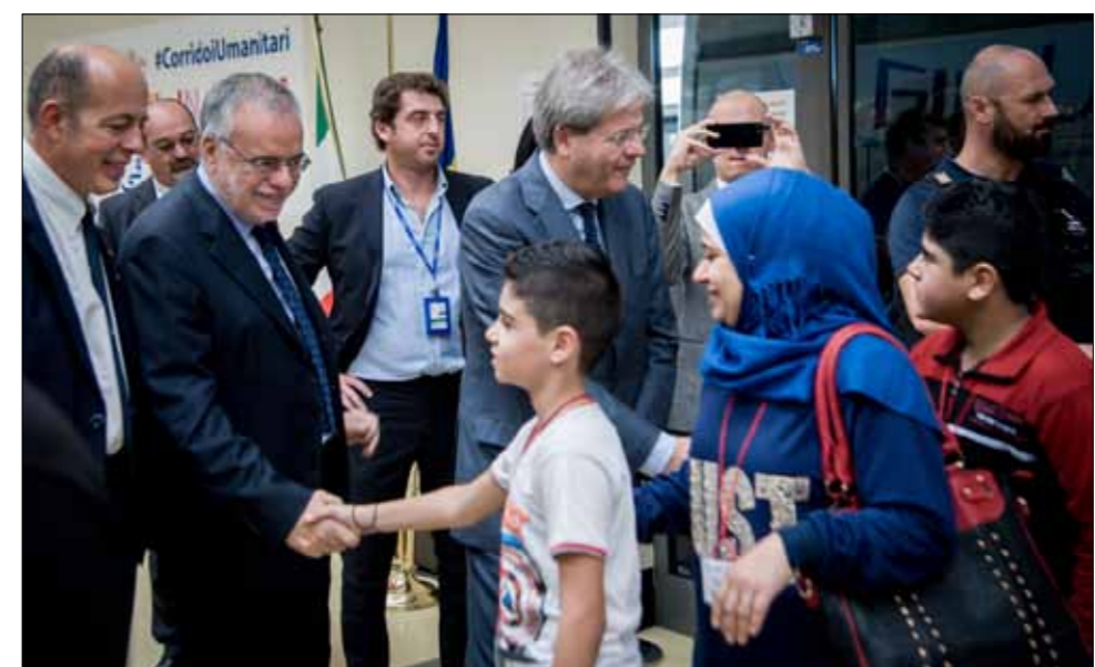
L'an dernier, Sant'Egidio mettait en place des couloirs humanitaires vers l'Italie.

Le 27 février 2016, la communauté Sant'Egidio mettait en place des couloirs humanitaires vers l'Italie pour des familles syriennes ayant fui la guerre. Près de 700 personnes ont pu venir en Italie, saines et sauvées, grâce à ces couloirs, fruits d'un accord entre Sant'Egidio, les ministères italiens des Affaires étrangères et de l'Intérieur ainsi que la fédération des Eglises évangéliques et l'Eglise vaudoise d'Italie. La France répond à son tour à la détresse des réfugiés en signant un accord en présence du président François Hollande, du ministre de l'Intérieur Bruno Le Roux et du ministre des Affaires étrangères Jean-Marc Ayrault. Le projet concernera, en un an et demi, 500 réfugiés syriens et irakiens actuellement au Liban, "avec une priorité aux personnes les plus vulnérables" (familles avec enfants, femmes seules, personnes âgées, malades, personnes porteuses de handicap). "Comme les 700 réfugiés arrivés en Italie", souligne Sant'Egidio,