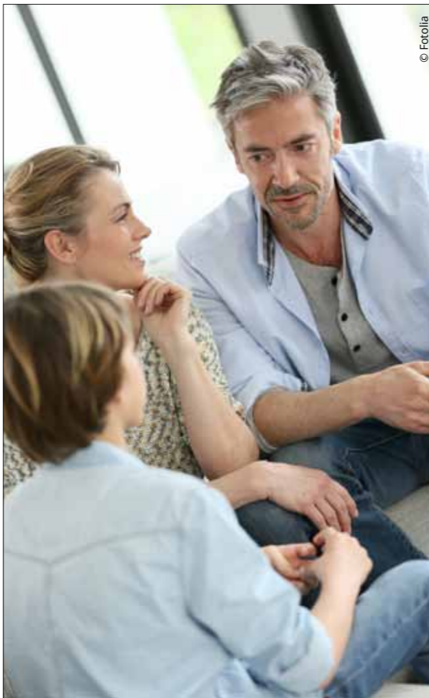
L'éducation au politique passe par la parole et l'échange, mais aussi par l'engagement dans la vie collective.