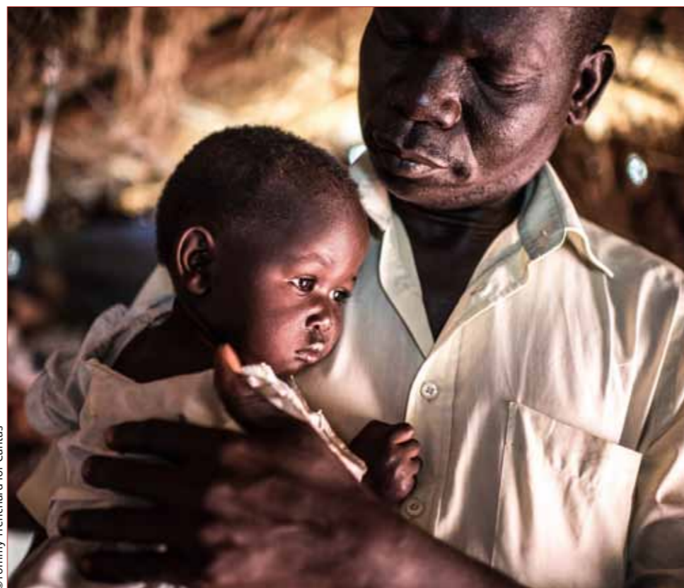
Un père et sa fille dans le camp de réfugiés de Bidi Bidi.