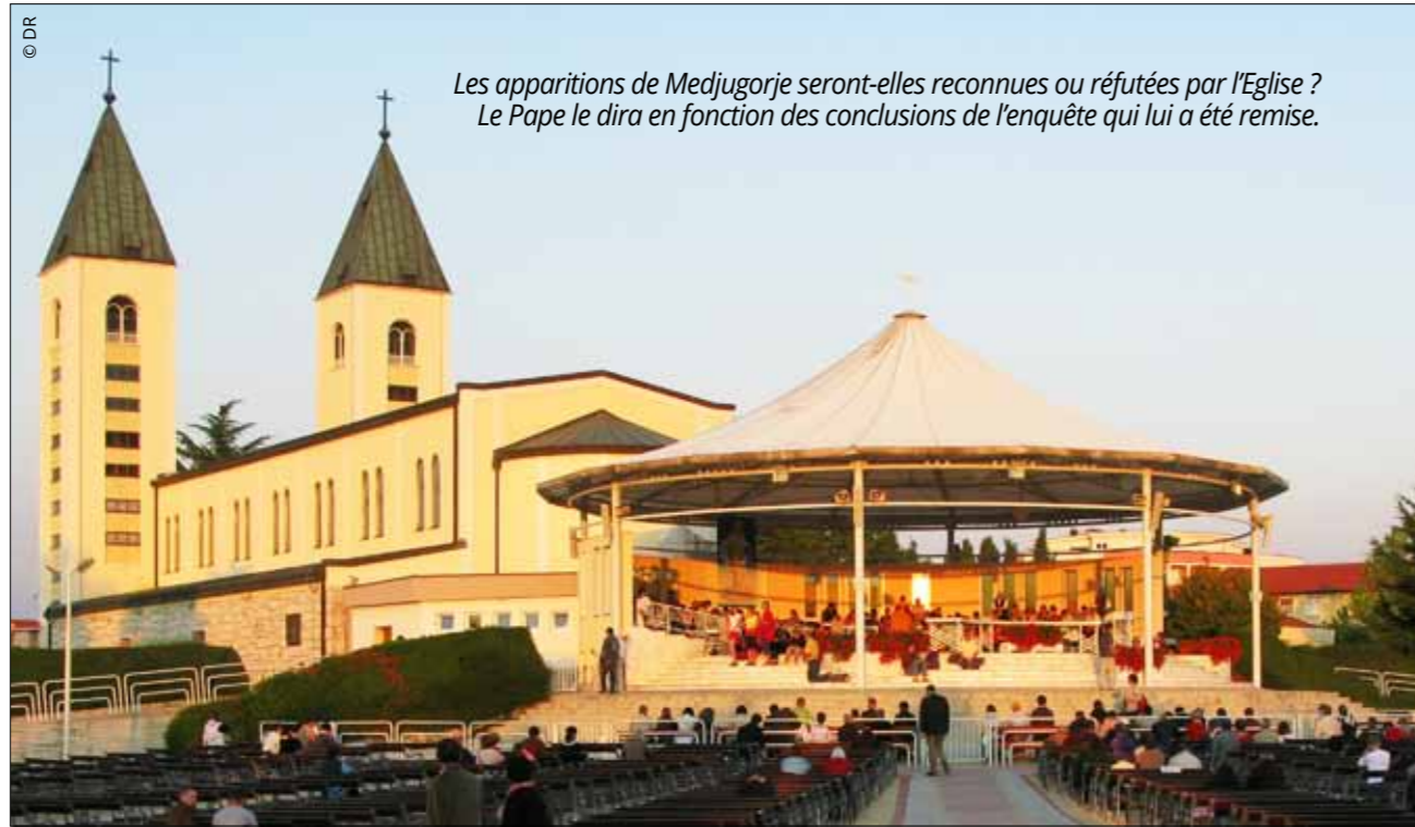
Les apparitions de Medjugorje seront-elles reconnues ou réfutées par l'Église ? Le Pape le dira en fonction des conclusions de l'enquête qui lui a été remise.

Deux autres positions peuvent être adoptées par l'Église en la matière: un "constat de supernaturalité" – les événements sont reconnus comme authentiques –, ou un "non constat de supernaturalité". Ce dernier cas de figure signifie que l'Église ne peut conclure positivement