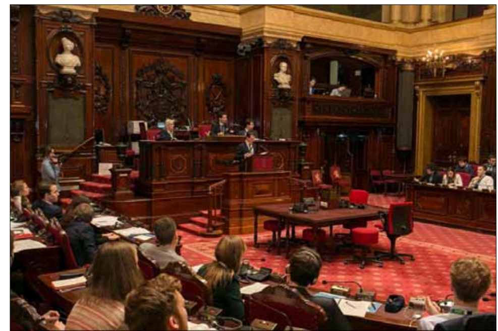
Une centaine de jeunes participaient à ce JPJ.

Sur ce dernier sujet, il était intéressant de noter l'évolution des débats, à partir du projet de loi initial qui consistait à financer de manière volontaire, par une contribution personnelle, le culte de son choix. La "ministre" en charge de préparer ce dossier s'était inspirée du modèle allemand. Au sein de la commission préparatoire à la séance plénière, il s'est révélé difficile de déterminer ce qu'était une religion ou un culte reconnus. Les jeunes ont voulu éviter d'exclure certaines croyances au motif qu'elles ne reposaient pas sur une structure hiérarchique. L'exemple du bouddhisme a semblé symptomatique de cette difficulté. Les parlementaires désignés pour cette semaine ont donc reformulé le projet de